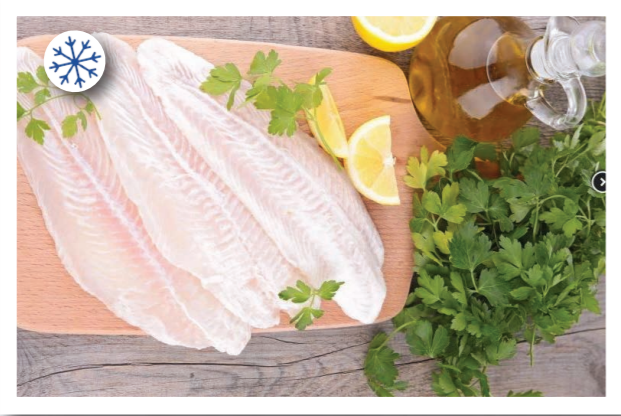
GLN122 FILET DE SOLE A PLAT 80/120 2KG GALANA