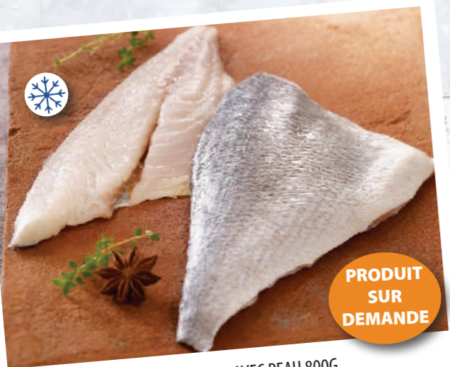
LRN02 DORADE ROYALE AVEC PEAU 800G