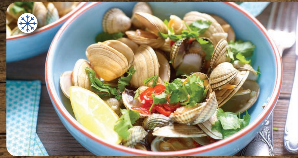
GLN117 PALOURDES ENTIERES CUITES IQF 1KG (800G net) 60/80 GALANA