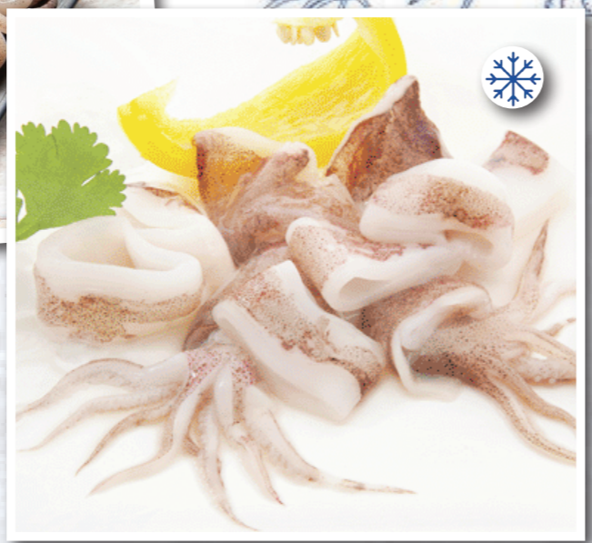
SVG24 CALAMARS ANNEAUX ET TENTACULES U10 800G SOAVEGEL