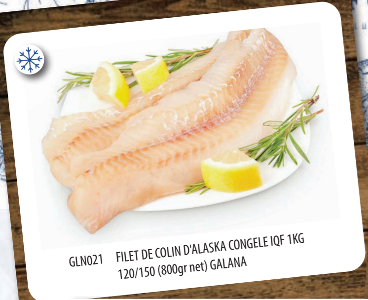
GLN021 FILET DE COLIN D'ALASKA CONGELE IQF 1KG 120/150 (800gr net) GALANA