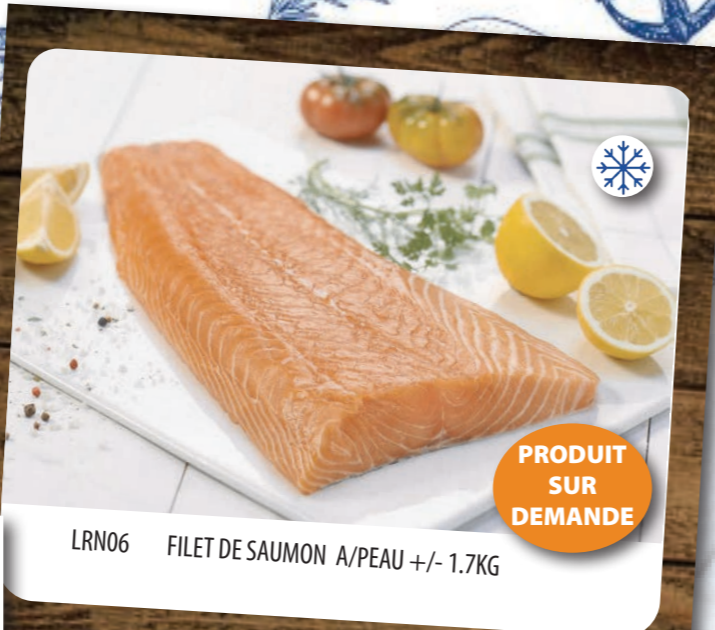
LRN06 FILET DE SAUMON A/PEAU +/- 1.7KG