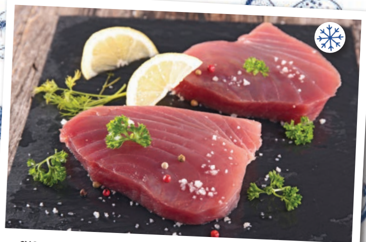
SVG69 FILET DE THON PINNE GIALLE 2 x +/- 2KG LOPEZ SOAVEGEL