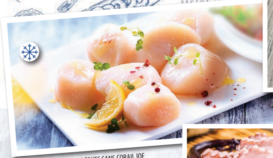
GLN027 NOIX DE ST JACQUES SANS CORAIL IQF 10/20 800G NET GALANA