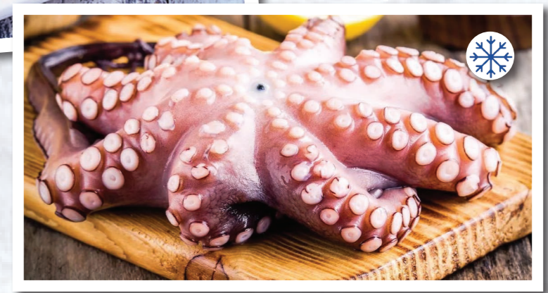
SVG70 POULPET7 MAROC 500/800 12KG SOAVEGEL