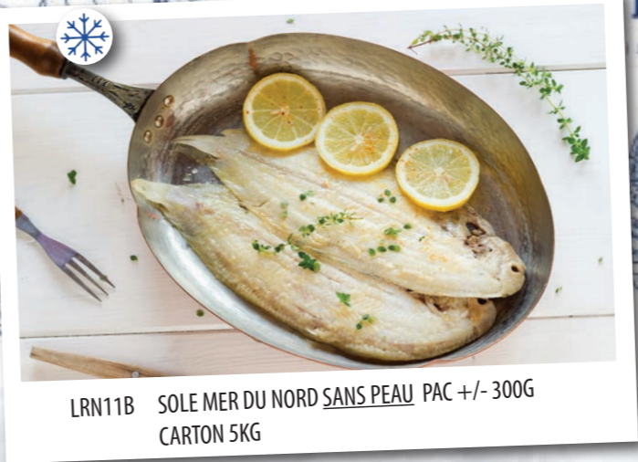
LRN11B SOLE MER DU NORD SANS PEAU PAC +/- 300G CARTON 5KG