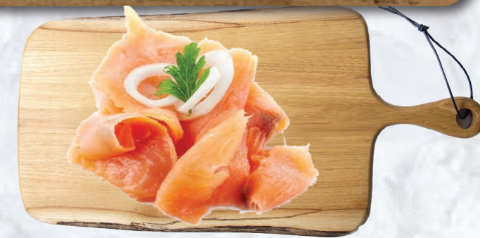
DWG02 PARURE DE SAUMON FUMÉ SURGELÉE 1KG ATLANTIK

Pour les tarifs au cours et les disponibilités, contactez-nous!