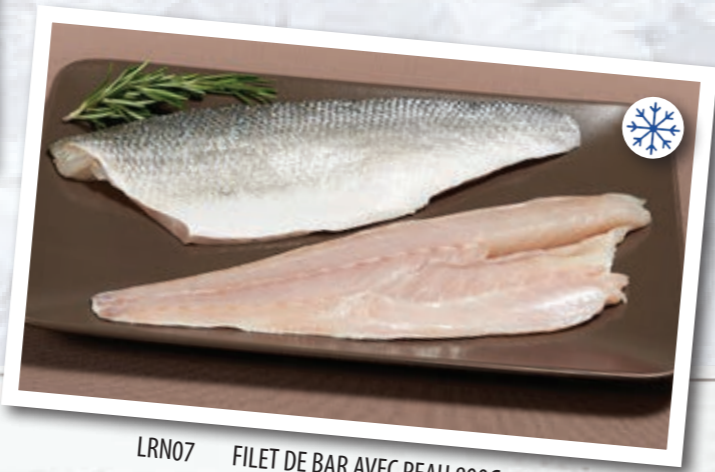
LRN07 FILET DE BAR AVEC PEAU 800G