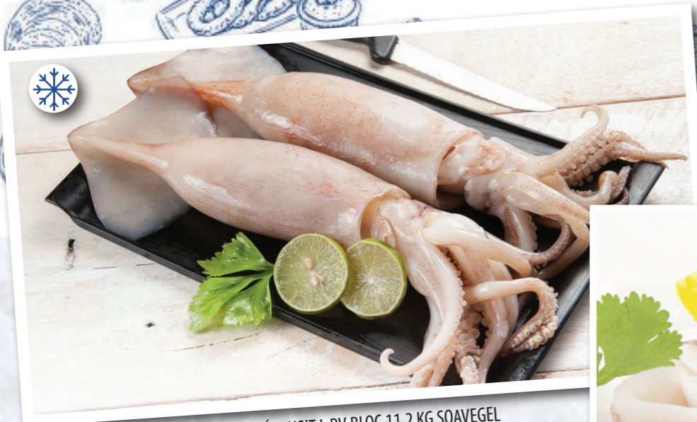
SVG93 CALAMARS NON NETTOYÉS LUSIT L PV BLOC 11,2 KG SOAVEGEL SVG13 CALAMARS NETTOYES THAILANDE, U5 6 x 1,4KG SOAVEGEL