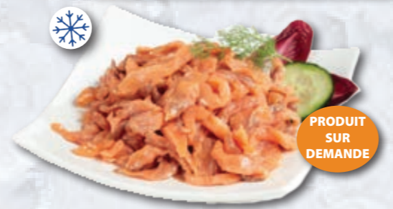
ATL855 CHUTES DE SAUMON FUMÉ SURGELÉES 1KG ATLANTIK

DWG01 SAUMON FUMÉ PRÉTRANCHÉ ORIGINE NORVÈGE 1,2KG