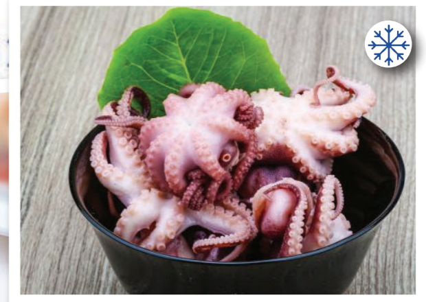
SVG25 PETITS POULPES 10/20 INDONÉSIE 10 X 900G SOAVEGEL