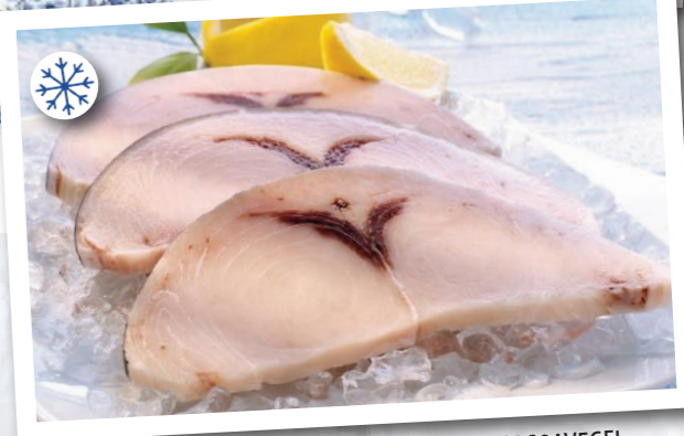
SVG22 FILET D'ESPADON SANS OS 5KG LOPEZ SOAVEGEL SVG102 TRANCHE D'ESPADON 6,4KG IQF SOAVEGEL